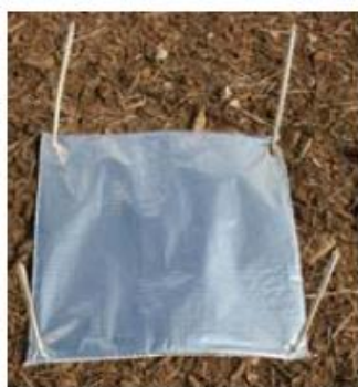
Piège à limaces, face aluminium visible

A partir de la levée, le seuil de nuisibilité est atteint lorsque plus de 20 % des plantules de la céréale affichent des attaques de limaces.