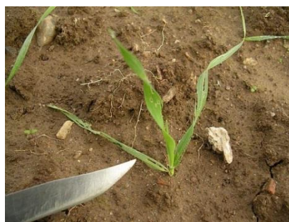
Plantules effilochées par les limaces