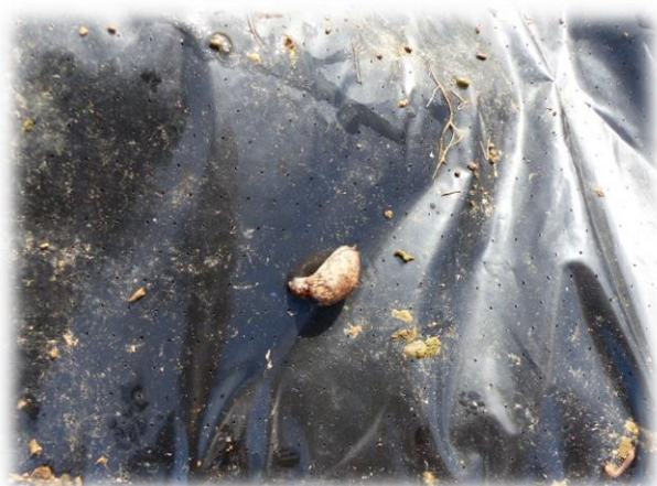
Limace grise adulte piégée sur une parcelle du réseau.

Pour ce premier bulletin Céréales de la campagne 2017, 6 parcelles de blé tendre ont été observées et aucune parcelle d'orge d'hiver n'a été observée cette semaine. Les parcelles de blé tendre observées correspondent à des semis précoces de début octobre, les conditions sèches du moment et les gelées matinales de la semaine dernière provoquent une levée lente. Actuellement elles sont entre le stade levée et 1 feuille pour la parcelle la plus précoce. Selon les secteurs de la région, les semis sont bien avancés où sont en cours, les conditions météorologiques annoncées dans les prochains jours sont très favorables aux semis. Du côté des ravageurs, quelques dégâts de limaces sont observés dans deux parcelles en Seine-Maritime et dans l'Eure, 2 et 5 % des plantules présentent des dégâts. Le seuil de nuisibilité n'est donc pas atteint dans ces deux parcelles.