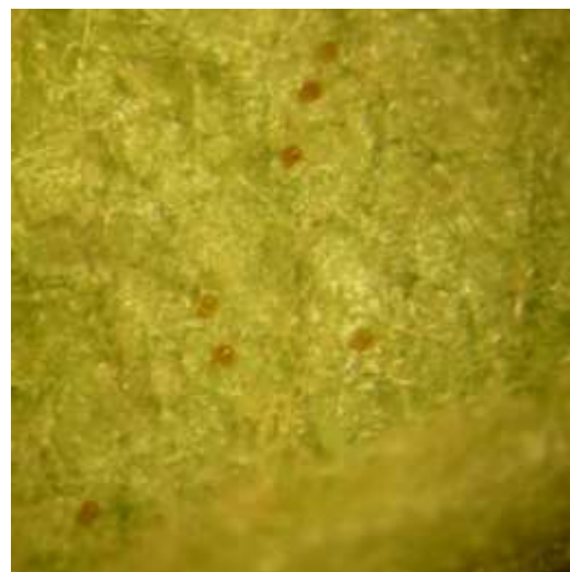
Œufs d'acariens rouges

La présence des acariens rouges est très hétérogène d'un verger à l'autre mais aussi d'une variété à l'autre (jusqu'à 60% de feuilles occupées pour certains vergers du réseau).