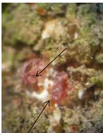
Femelle de cochenilles rouges du poirier avec œufs