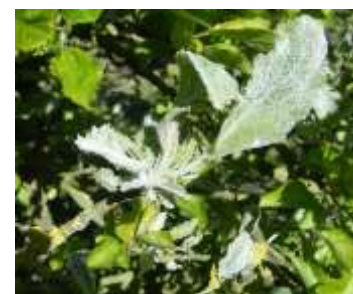
Oïdium sur pousse

Nous sommes en période de forte pousse et les jeunes feuilles sont très sensibles à l'oïdium.