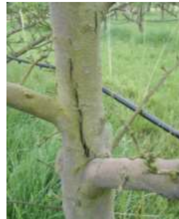
Dégât de cochenilles rouges du poirier