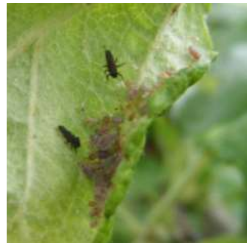
Larves de coccinelles dans un foyer de puceron cendré