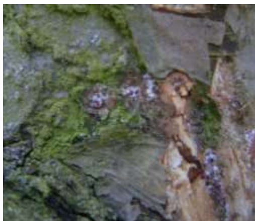
Cochenilles rouges du poirier

Un auxiliaire prédateur est connu contre ce ravageur, une coccinelle l' Exochomus quadripustulatus .