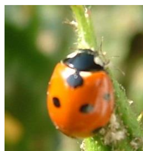
Coccinelle à 7 points