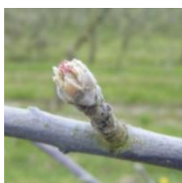
Pommier : stade C

Stade sensible pour les poiriers : dès stade C3-D