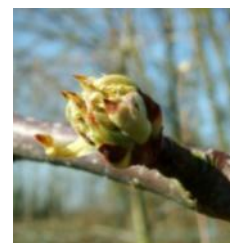
Poirier : stade C3

D'après les résultats de modélisation INOKI®-DGAL :