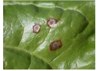
Cercosporiose : taches grises avec une bordure rouge ou brunâtre, avec présence de points noirs au centre. Contrôler à la loupe la présence de points noirs.