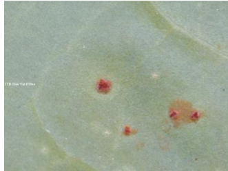
Rouille : pustules poudreuses orangées