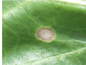
Ramulariose : taches brunes avec liseré sombre présentant au centre de petits points blancs. Contrôler à la loupe la présence de points blancs.