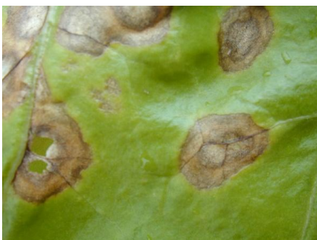
Ramulariose : présence à la loupe de points blancs observables au centre des taches.