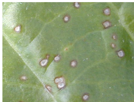
Cercosporiose : présence à la loupe de points noirs observable au centre des taches