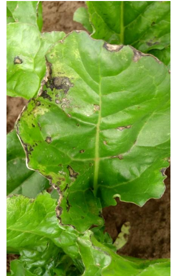
Pseudomonas : absence de point noir au centre

Symptômes : taches noirâtres de formes variables sur le bouquet foliaire