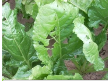
Morsures de noctuelles