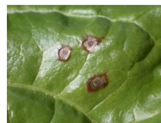
Cercosporiose : taches grises avec une bordure rouge ou brunâtre, avec présence de points noirs au centre. Contrôler à la loupe la présence de points noirs.