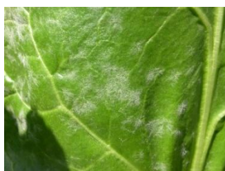
Oïdium : mycélium blanc grisâtre poudreux.