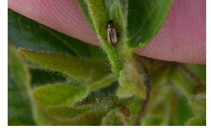
Galéruque de la viorne Pyrrhalta viburni FREDON BN

La présence d'adultes de galéruque de la viorne, Pyrrhalta viburni , a été observée sur un lot de Viburnum tinus . Normalement, cette galéruque passe l'hiver sous forme d'œuf. Il semblerait que quelques individus ont profité de la douceur de l'hiver.