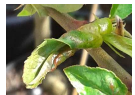
Cloque du pêcher Taphrina deformans FREDON BN

Evolution à suivre : la météo n'est pas favorable à son développement. Un temps frais et humide favorise la prolifération de ce champignon.