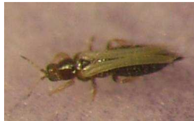
Adulte de thrips (Taille réelle 0,8mm à 1,2mm) FREDON BN