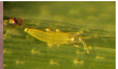
Larve de thrips (Taille réelle 0,6mm à 0,8mm) FREDON BN