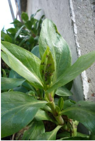
Pucerons sur valériane

Pour autant, des colonies de pucerons sont déjà observées sur certains végétaux, comme ci-dessous sur valériane. Point positif, des pucerons momifiés ont été identifiés au sein des colonies.