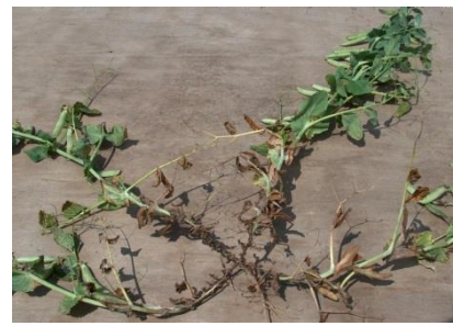
A.MOUSSART – Terres Inovia