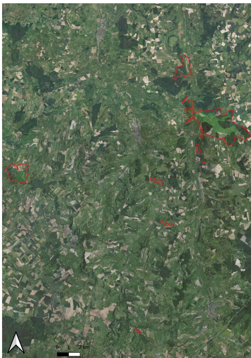
Répartition des zones humides sur le site Natura 2000 « Haute Vallée de la Touques et ses affluents »

La carte, ci-après, localise (en vert) les zones humides au sein du périmètre du site Natura 2000.