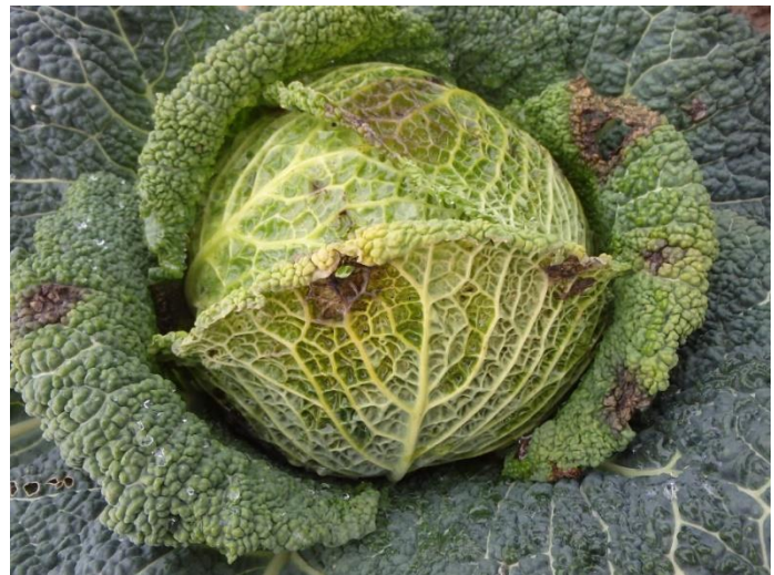
Taches foliaires typiques sur chou de Milan

La biologie de cette maladie et les conditions favorables ne sont pas formellement identifiées. Une forte humidité semble nécessaire pour les taches foliaires.