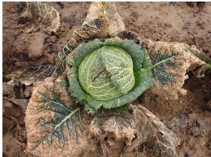
Dégâts de gel

Des dégâts de gel sont observés dans certaines parcelles sur les feuilles de la couronne.