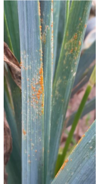
Rouille sur poireau

En cas de redoux ( T^{\circ} > 10^{\circ}\text{C} ), soyez vigilants en particulier sur les variétés sensibles.