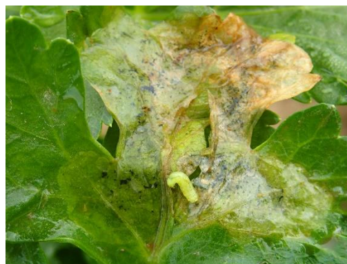
Mouche du céleri et galerie avec asticot de mouche du céleri (Sileban)