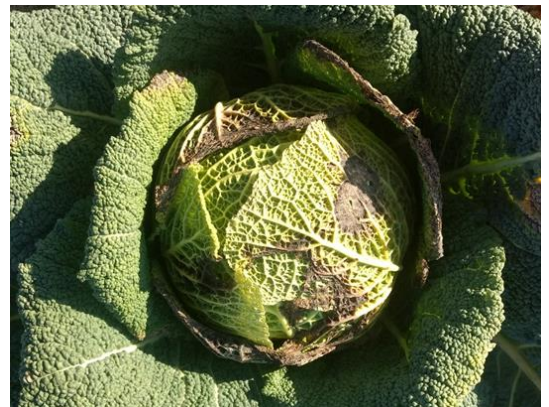
Taches foliaires de la maladie

Ces taches nécessitent un parage plus important des pommes.