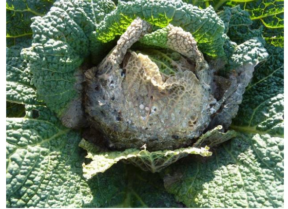
Sclérotinia sur chou de Milan (CA 76)

Les conditions actuelles : températures douces et sols humides sont favorables à l'expression de cette maladie. Cette maladie est inféodée à la parcelle.