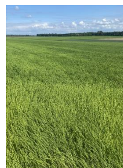
Lin de printemps à 20 cm