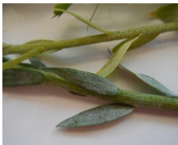
Photo : Mycélium d'oïdium sur tiges et feuilles (D. CAST - ARVALIS).

Dès l'apparition des premières étoiles sur feuilles