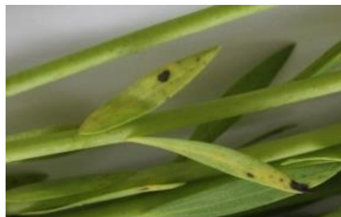
Photo : Septoriose sur feuille de lin début floraison (BBCH 61)

Les conditions actuelles sont favorables à la septoriose, maladie qui se développe en général en fin de cycle de végétation. Il convient de surveiller l'apparition de symptômes éventuels.