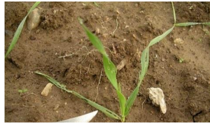
Plantules effilochées par les limaces

Les céréales sont sensibles aux limaces de la levée jusqu'au stade 3-4 feuilles. Les situations les plus à risque concernent les parcelles argileuses, motteuses ou avec des résidus de culture abondants.