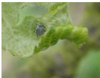
Fondatrice de puceron cendré

Des fondatrices de pucerons cendrés ont été observées dans toutes les régions. Mais elles ne sont pas présentes dans tous les vergers et encore moins sur toutes les variétés. Ces pucerons sont observés sur des variétés ayant atteint au moins le stade D3 : Judaine, Judeline, Petit Jaune, ... pour les pommes à cidre et Reinette, Boskoop, Golden, .....pour les pommes à couteau. Les premiers enrroulements sont même déjà visibles. Aucun foyer n'a pour le moment été observé.