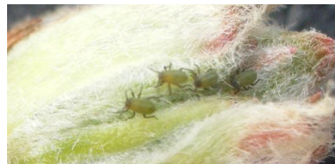
Pucerons verts non migrants