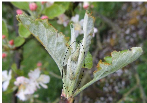
Charançons phyllophages et leurs dégâts

Attention, aux jeunes vergers ou aux vergers surgreffés, où les dégâts peuvent avoir des conséquences graves.