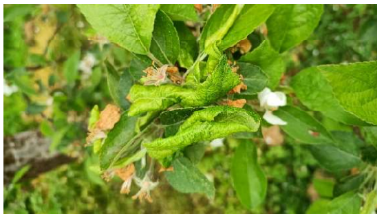
Feuilles enroulées à cause des pucerons cendrés