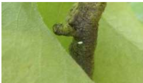
Œuf de chrysope

Les adultes ne sont pas des prédateurs, ils se nourrissent de miellat, de nectar et de pollen. Les larves munies de puissantes mandibules dévorent plus de 600 pucerons avant de se transformer en nymphe. En plus des pucerons, la larve consomme des psylles, des araignées rouges, des thrips, des mouches mineuses, des chenilles, des cochenilles farineuses et des œufs de papillons.