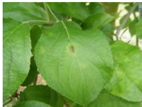
Taches de tavelure

Des taches de tavelure sont visibles sur Judeline en Pays de la Loire et en Normandie, et parfois en grande quantité sur feuilles de rosette.