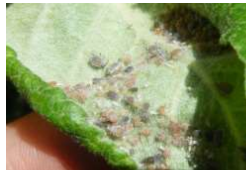
Foyer de puceron cendré

Ces pucerons sont observés sur les variétés ayant atteint au moins le stade D3.