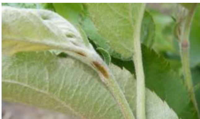
Dégâts de gel sur pousses

Ces blessures peuvent être des portes d'entrées à différentes maladies.