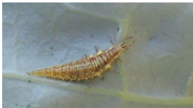
Larve de chrysope