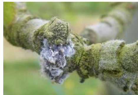
Foyer de pucerons lanigères

Le micro-hyménoptère Aphelinus mali n'a toujours pas été observé.