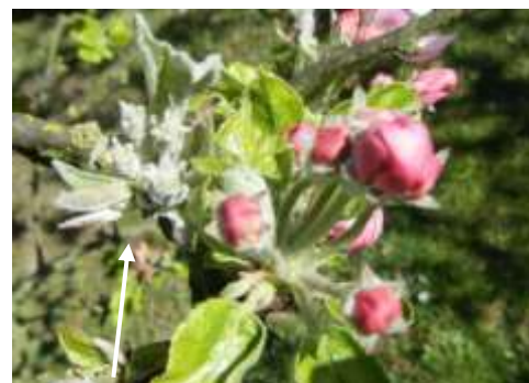
Bouquet floral oïdié

Cependant, avec les températures basses de la semaine dernière et la sortie peu active des nouvelles feuilles, la maladie s'est peu développée cette semaine