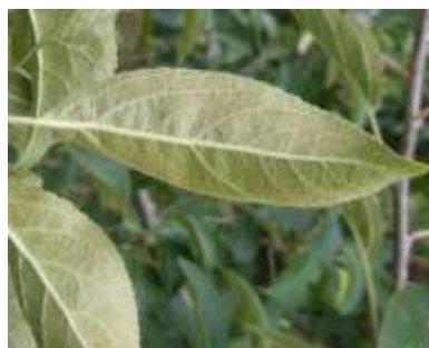
Dégâts de phytoptes libres