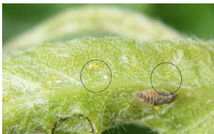
Adulte et œufs de psylle

A suivre en fonction des conditions climatiques.