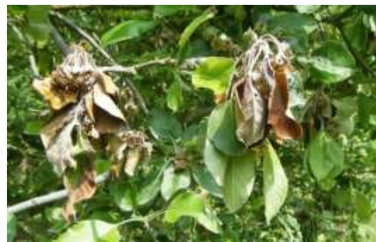
Moniliose sur fleurs

Les fleurs et les quelques feuilles sous-jacentes restent agglomérées en une masse sèche caractéristique.