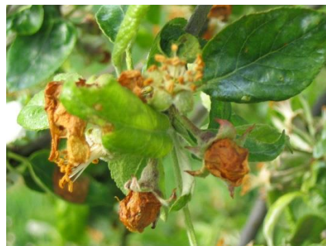
Fleurs en "clou de girofle"

Les fleurs ne s'épanouissent pas et brunissent parce que les larves d'anthome, qui sont à l'intérieur, se nourrissent des pièces florales. Les fleurs prennent un aspect de "clou de girofle".