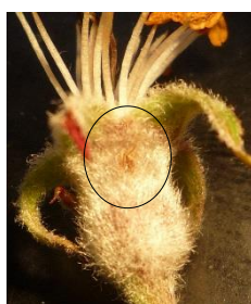
Incision de ponte