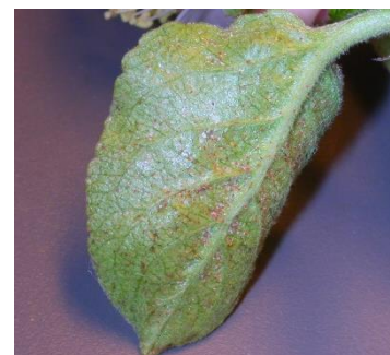
Forte population d'acariens