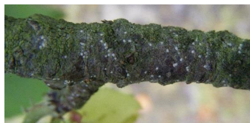
Cochenilles virgules en migration