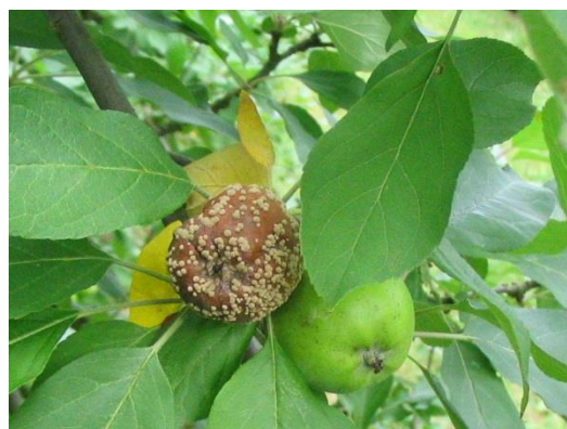
Moniliose sur fruit