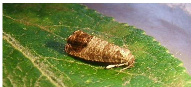
Adulte de carpocapse

En Normandie et en Bretagne, nous sommes proches de la fin du vol de la première génération. Les vols et les captures sont plus faibles.