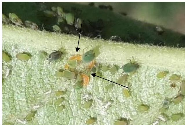
Cécidomyies dans un foyer de pucerons verts non migrants

Au sein des foyers de pucerons verts non migrants, on peut observer des petites larves orange. Ce sont des larves de cécidomyies prédatrices. Une larve peut consommer de 7 à 20 pucerons par jour et en tuer plus qu'elle n'en consomme.