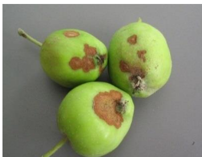
Taches de tavelure

Il n'y a plus de contaminations primaires.