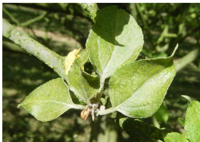
Dégâts d'acariens rouges

Les populations d'acariens sont généralement faibles dans les trois régions.