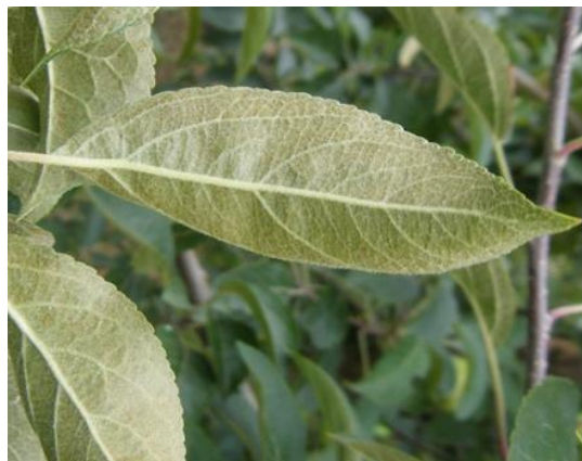
Dégâts de phytoptes libres