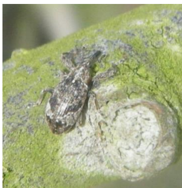
Anthonome adulte (taille : 4 à 6mm)