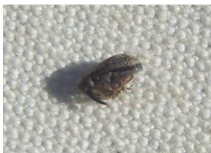
Anthonome adulte immobile sur le tapis de battage