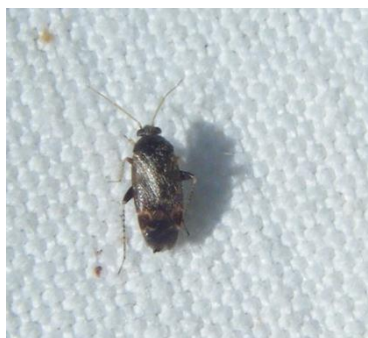
Punaise miride : taille 4 mm