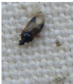
Punaise Orius : taille 2,5 mm

On observe de plus en plus de coccinelles adultes ( Adalia et Chilocorus ), de punaises prédatrices et d'adultes de syrphes et de chrysopes qui cherchent un lieu pour pondre au plus près des sources de nourriture.