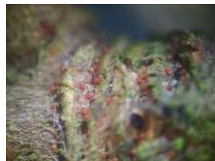
Œufs d'acarien rouge

Pas d'éclosion à prévoir pour le moment.