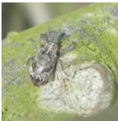
Anthome adulte (taille : 4 à 6mm)

Ils pondent dans les bourgeons des pommiers qui ont atteint le stade B/C .