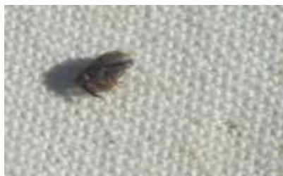
Anthome adulte immobile sur le tapis de battage