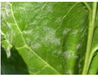
Oïdium : mycélium blanc grisâtre poudreux.