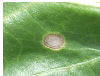
Ramulariose : taches brunes avec liseré sombre présentant au centre de petits points blancs. Contrôler à la loupe la présence de points blancs.