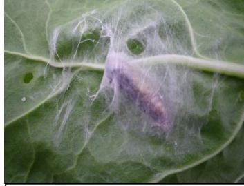
Cocon de noctuelle