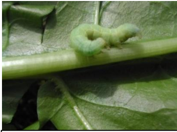
Chenille de noctuelle

Symptômes : la noctuelle défoliatrice se remarque par de nombreuses perforations sur les feuilles ainsi que par des déjections noirâtres. Les jeunes chenilles sont détectables dans le feuillage en dehors des heures chaudes de la journée.