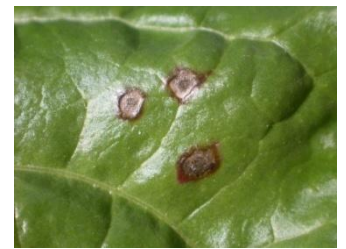
Cercosporiose : taches grises avec une bordure rouge ou brunâtre, avec présence de points noirs au centre. Contrôler à la loupe la présence de points noirs.