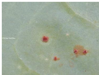
Rouille : pustules poudreuses orangées