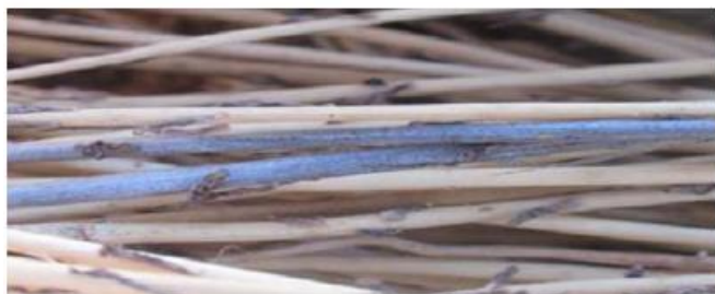
Photo : Verticilliose sur paille de lin en cours de rouissage

Analyse du risque : Les conditions sèches actuelles sont favorables à son développement sur tiges (apparition de zébrures marrons). Il convient de surveiller son développement en cours de rouissage (apparition des microscélérotés sur les pailles leur donnant une couleur bleu métallique). Si ces symptômes apparaissent, il convient d'enrouler les linières le plus vite possible pour ne pas dégrader trop fortement les pailles de lin.