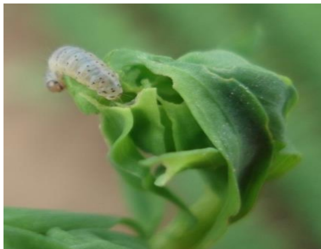
Tordeuse ( Cnephasia pumicana ) sur lin

Les infestations sont souvent bénignes, mais les tordeuses peuvent s'attaquer aux fleurs et être préjudiciables à la production de graines. Malgré un aspect spectaculaire des symptômes, la faible importance des dégâts justifie rarement un traitement, sauf en production de semences si les populations dépassent 10 larves/m 2 .