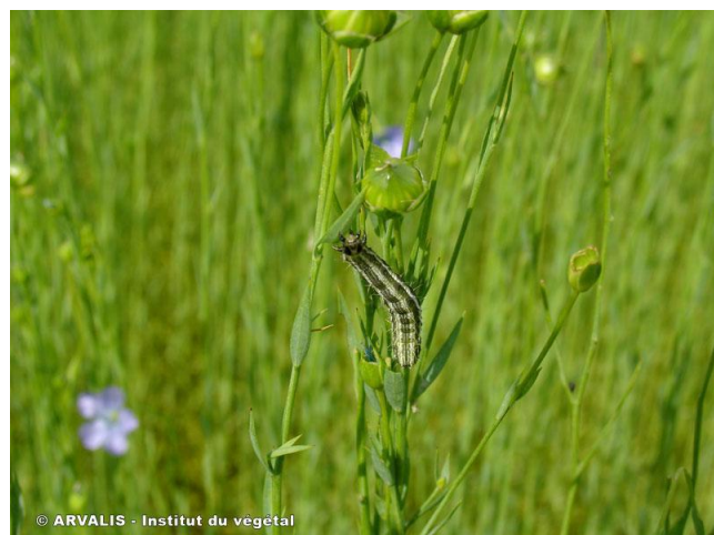
Noctuelle Défoliatrice ( Autographa gamma ) sur lin

Ce ravageur s'attaque aux lins en coupant les tiges mais également en dévorant les feuilles, les boutons floraux et parfois les graines en formation. Les dommages sont ponctuels et concernent principalement les graines en cas de forte attaque.