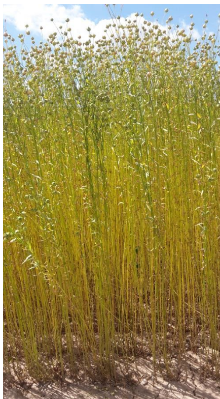
Avancée de stade d'une linière semée le 16 Avril

Les linières s'échelonnent du stade début floraison (BBCH81) jusqu'au stade tiges sèches (BBCH90).