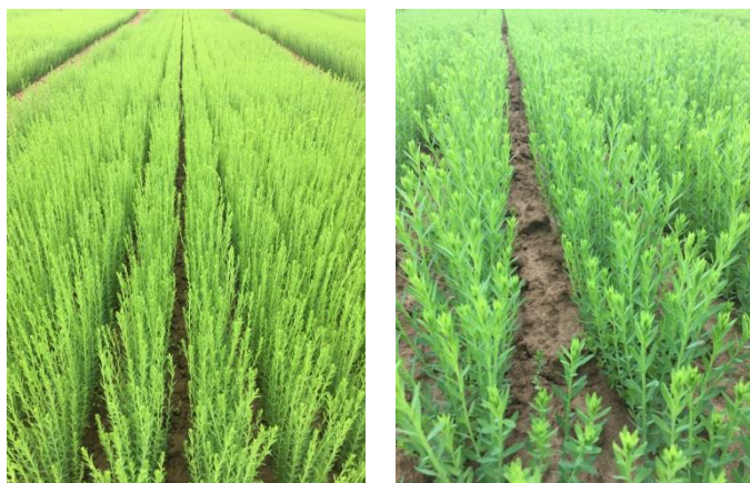
Comparaison des stades entre deux dates de semis (16 Avril à gauche et le 26 avril à droite)

Les stades s'échelonnent du stade 10 cm (BBCH31) jusqu'au stade Boutons floraux visibles (BBCH51) avec une majorité des linières au stade 20 cm.