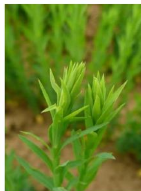
Conséquences des piqûres de thrips sur lin en cours d'élongation.