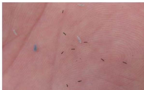
thrips recueillis par balayage du couvert : le seuil est ici dépassé (+ de 5 insectes).

-Sur lin supérieure à 20cm, procéder au balayage avec une main humide