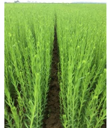
Photo : E.LAMME- ARVALIS Institut du vegetal : Lin au stade 25cm pour un semis du 16 avrl.

Cette semaine, les observations ont été réalisées dans 31 parcelles fixes en Normandie.