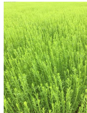
Lin au stade 50cm pour un semis du 16 avr.

Cette semaine, les observations ont été réalisées dans 35 parcelles fixes en Normandie.