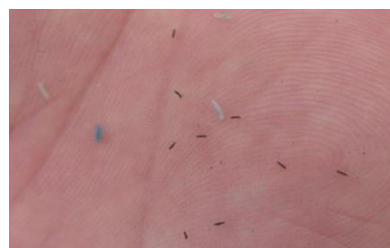
thrips recueillis par balayage du couvert : le seuil est ici dépassé (+ de 5 insectes).

Fin de période dans la majorité des linières. Surveiller les parcelles semées en avril et celles à double levée.