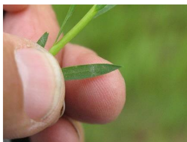
Premières étoiles d'oïdium sur feuille