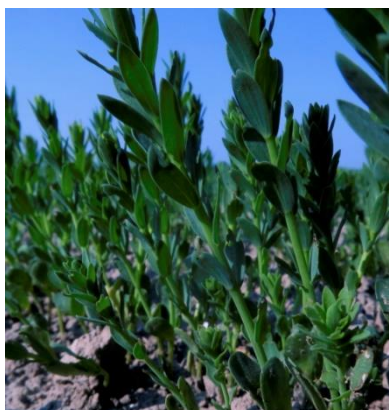
Linière au stade 7 cm