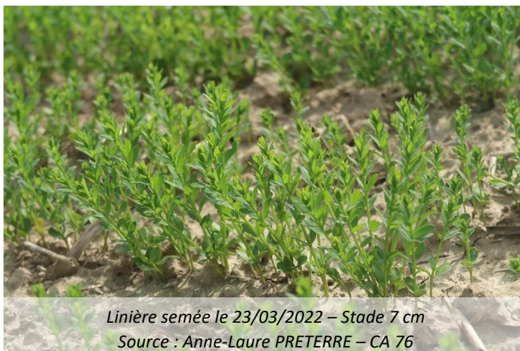
Linière semée le 23/03/2022 – Stade 7 cm