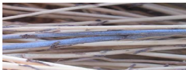
Photo : Les symptômes en cours de rouissage correspondent à l'apparition de microsclérotés sur les pailles leur donnant une couleur bleu métallique - Source : ARVALIS