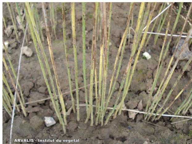
Photo : Les symptômes sur tige s'apparentent à un jaunissement suivi d'un dessèchement de la partie supérieure des plantes

Les conditions sèches actuelles sont favorables à son développement sur tiges (apparition de zébrures marrons). Il convient de surveiller son développement en cours de rouissage (apparition des microsclérotés sur les pailles leur donnant une couleur bleu métallique). Si ces symptômes apparaissent, il est préconisé d'enrouler les linières le plus vite possible pour ne pas dégrader trop fortement les pailles de lin.