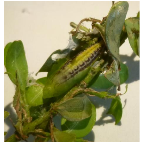
Chrysalide de pyrale du buis

Méthodes prophylactiques : il n'y a pas de méthode prophylactique efficace.