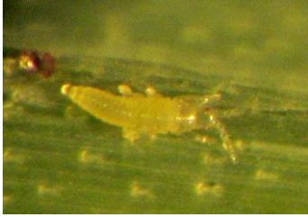
Larve de thrips taille réelle 0,6 à 0,8mm

Sous serre, des traces de piqûres sur les feuilles et fleurs avec la présence de quelques thrips et parfois des larves ont été observés sur cyclamen, géranium lierre simple et chrysanthème multifleurs.