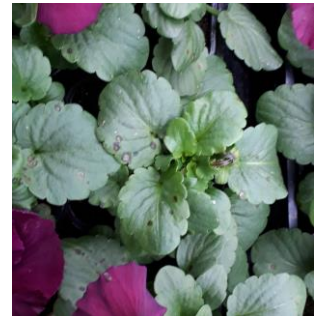
Ramularia sur pensée

Evolution à suivre : à surveiller, l'humidité favorise le développement de ce champignon. Les conditions optimales de développement sont à des températures de 15°C et une humidité relative >95%.