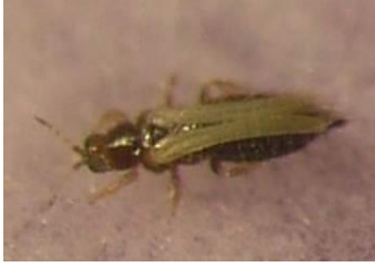
Adulte de thrips taille réelle 0,8 mm à 1,2mm