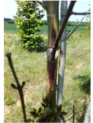
Symptôme sur tronc de la Chalarose

Les principaux symptômes sont des nécroses corticales avec couleur orangée de l'écorce. Les plants atteints ne sont plus commercialisables.