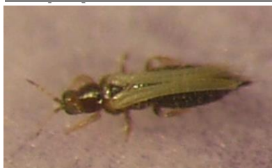
Adulte de thrips

Quelques Thrips ont été observés sur quelques géranium lierre simple, géranium zonale et verveine.