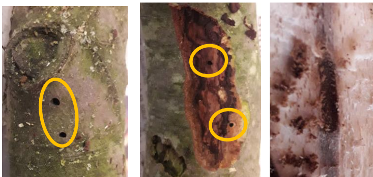
Trous (photo 1 et 2), sciures (photo 2 et 3) et galeries (photo 3) de scolytes.

Des attaques de scolytes ont été observées sur une culture de hêtre : présence de nombreux trous d'un diamètre d'environ 2mm avec présence de sciures sous l'écorce. La recherche n'a pas permis d'identifier les coupables car aucun insecte n'a été trouvé, les trous étant vides sans présence d'adultes ou de larves.