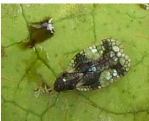
Adulte et excréments au revers d'une feuille

En extérieur, la présence d'adultes du Tigre du pieris, Stephanitis takeyai , a été observée sur Pieris japonica .