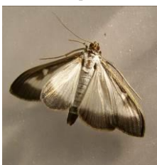
Piège et adulte de Pyrale du buis

Suivi des relevés des pièges mis en place en semaine 20 chez 8 producteurs du réseau normand.