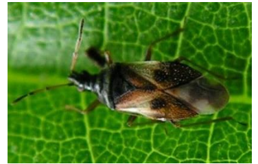
Adulte d'Anthocoride

Evolution à suivre : à surveiller, les conditions météo sont favorables à leur développement. Préservez les auxiliaires lorsqu'ils sont présents.