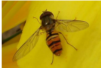
Adulte de syrphe