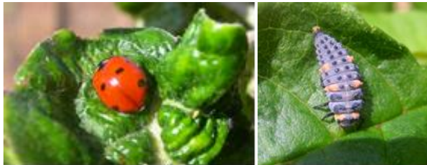
Adulte et larve de coccinelle

De nombreux auxiliaires sont très présents : larves, nymphes et adultes de coccinelles, adultes de syrphes, punaises anthocorides.