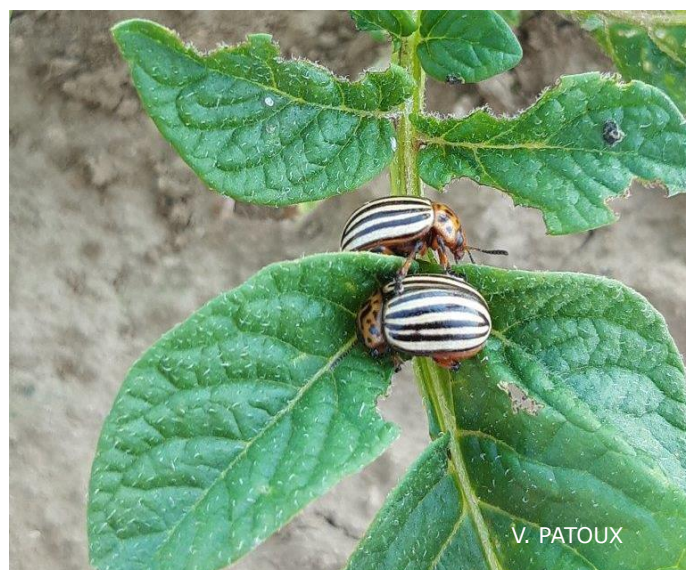
Doryphores adultes et leurs dégâts

La pression augmente, à suivre en fonction des conditions climatiques.