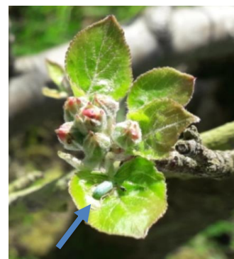
Charançon sur bouquet (M. Minier)