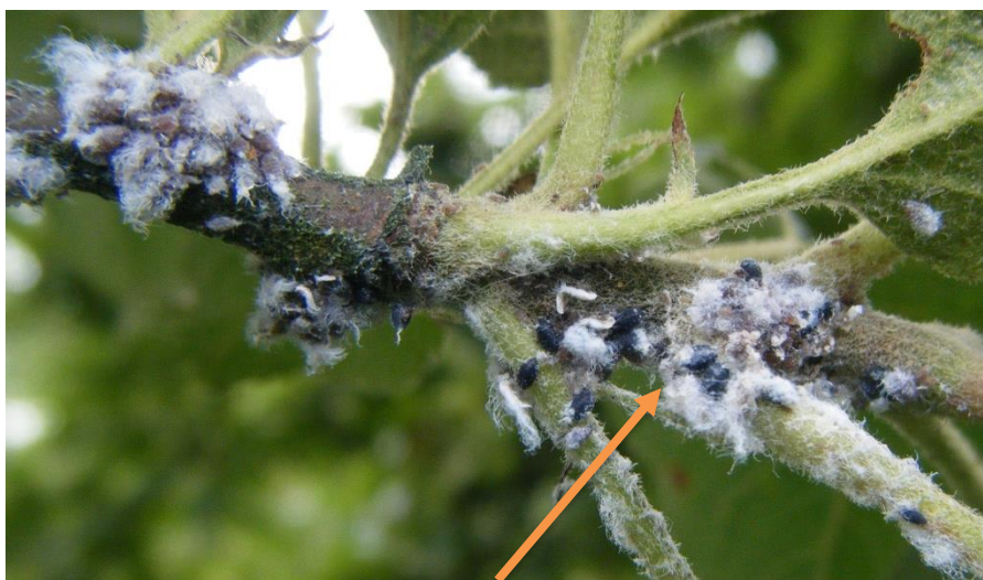
Pucerons lanigères parasités par Aphelinus mali (ils sont noirs et sans laine)

Leur présence est signalée dans les trois régions. Ce sont essentiellement de petits foyers qui sont observés. La migration sur les pousses est notée dans deux parcelles en Normandie. La présence de pucerons parasités par Aphelinus mali est observée dans deux vergers (un en Normandie et un en Bretagne).