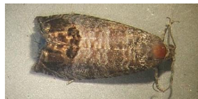
Papillon de carpodapse

Résultats des suivis des captures de carpodapse du pommier au 12/06/2024 (15/05 ; 23/05 ; 29/05 pour rappel).