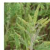
En fleur Août-Septembre