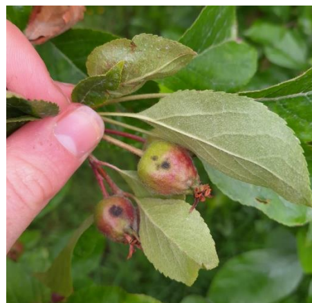
Taches de tavelure sur Judeline

Sur les fruits, des taches sont observées dans les trois régions sur les variétés Judeline et Judaine.