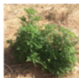
Stade végétatif Mai-Juillet