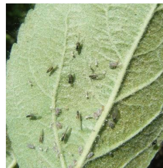
Pucerons cendrés ailés

Pour les vergers adultes (6-7 ans), suite à l'observation des premiers enroulements, réalisez une nouvelle observation la semaine suivante afin de noter la présence de la faune auxiliaire et/ou l'augmentation de la population de pucerons cendrés.