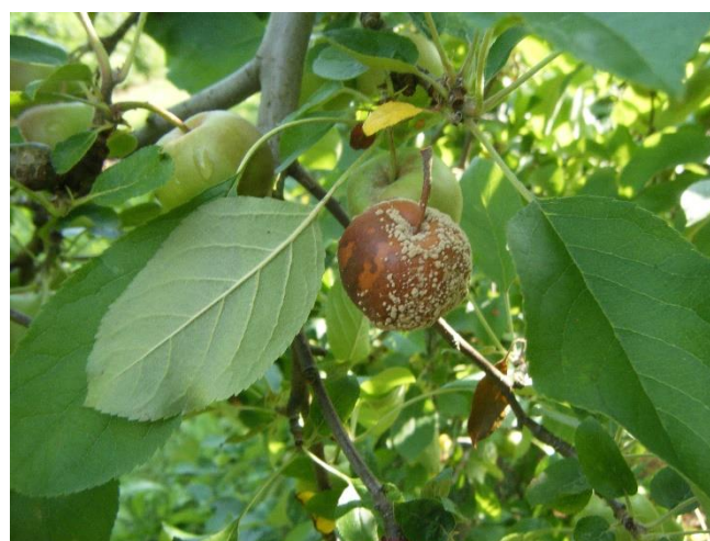
Fruit avec moniliose

En verger, les symptômes sur les fruits apparaissent à la faveur de blessures diverses (morsures de tordeuses, de forficules, de guêpes, dégâts de carpocapse, coups de bec d'oiseaux, grêle, fortes pluies...) : ce sont des pourritures fermes, brunes plus ou moins foncées, formant lorsque les conditions sont favorables (humidité) des coussinets bruns en cercles concentriques.