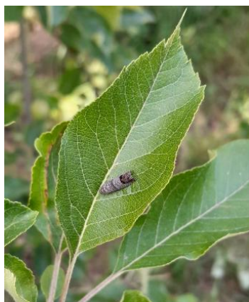
Adulte de carpocapse

Des dégâts sont observés cette semaine dans : 5 vergers en Pays de la Loire et 6 en Normandie.