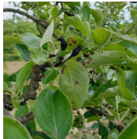
Taches de Black rot et fruits pygmés

https://ephytia.inrae.fr/fr/C/22034/Pomme-Principaux-symptomes