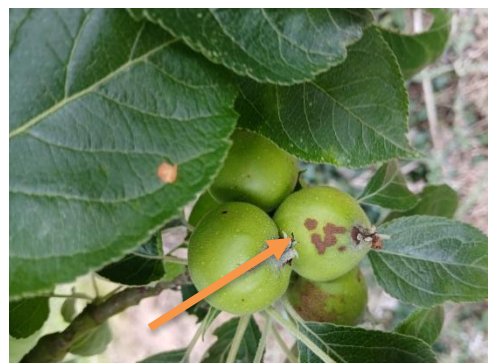
Taches de tavelure (AGRIAL)