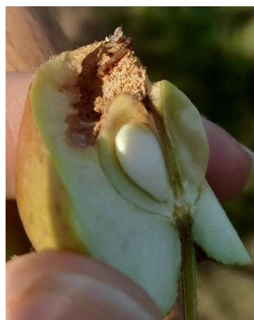
Dégâts sur Frequinette (CA PdeL)