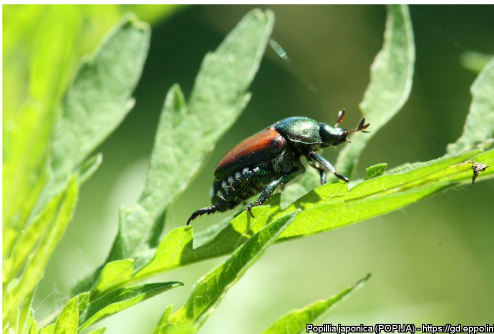
Popillia japonica (POPIJA) - https://gd.eppo.int

Il s'agit de la première détection de Popillia japonica dans la région Bourgogne-Franche-Comté et la première détection sur le territoire national en 2026.