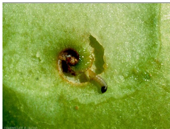
CHARMILLOT P. (ACW) Dégâts de Grapholita lobarzewskii observés sur une pomme coupée (photo P.J. Charmillot, Agroscope Changins-Wädenswil ACW)

A la différence du carpocapse, la piqûre est en forme de spirale de 5-6 mm de diamètre, avec une galerie fine et propre. Photo ci-contre, source Ephytia .