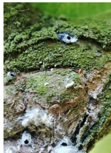
Pucerons parasités par Aphelinus mali

La présence de pucerons parasités par Aphelinus mali est observée dans plusieurs vergers.