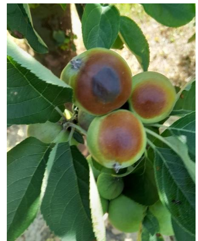
Fruits très brûlés sur Dabinett (CA PdeL)

Aux vues des conditions passées et annoncées, l'apparition de dégâts devraient se poursuivre