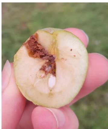
dégâts dans fruits (FREDON et CA PdeL)