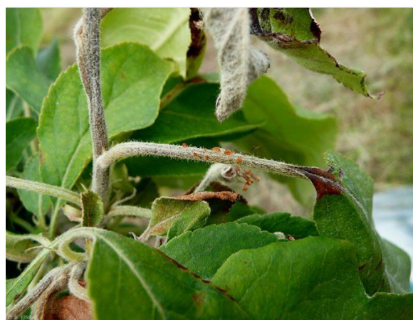
Exsudat sur le pétiole et nécrose sur la nervure centrale de la feuille de pommier - Feu bactérien

Les organes atteints (fleurs, pousses, ...) se nécrosent et noircissent. On observe une production d'exsudat : gouttelette blanc jaunâtre puis ambrée. Ce liquide qui contient la bactérie est collant.