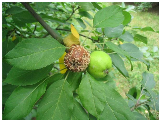
Fruit avec moniliose

En verger, les symptômes apparaissent pendant l'été et l'automne avant la récolte sur les fruits à la faveur de blessures diverses (morsures de tordeuses, de forficules, de guêpes, dégâts de carpocapse, coups de bec d'oiseaux, grêle, fortes pluies...) : ce sont des pourritures fermes, brunes plus ou moins foncées, formant lorsque les conditions sont favorables (humidité) des coussinets bruns en cercles concentriques.