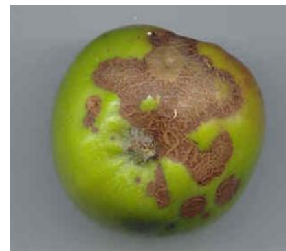
Tavelure sur fruit

https://draaf.normandie.agriculture.gouv.fr/IMG/pdf/bsv_arboriculture-fruits_transformes_bretagne-normandie-pays_de_la_loire_no01_du_22_03_2023_note_abeille.pdf