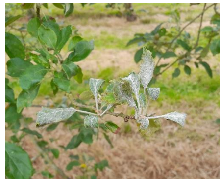
Oïdium sur Douce Moën

Une présence faible à moyenne est signalée sur des variétés plus ou moins sensibles : Douce Moën, Judeline, Petit Jaune, Judor, Binet Rouge, Peau de Chien et Pirouette. Une présence forte est notée sur Douce Moën dans un verger en Normandie