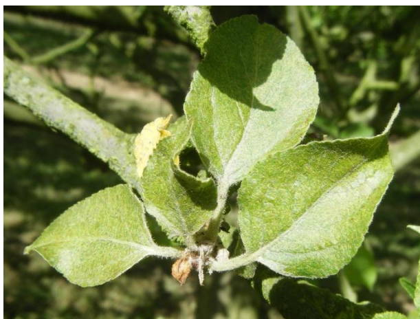
Dégâts d'acariens rouges

Les acariens prédateurs sont souvent peu nombreux. Les punaises prédatrices (notamment des genres Atractotomus sp et Heterotoma sp ) sont présentes en grand nombre et actives dans les vergers. (Cf BSV n°13 pour la description de ces auxiliaires). Des coccinelles Stethorus sp. sont également observées en Pays de la Loire.