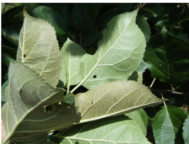
Brunissement de la face inférieure des feuilles causé par les phytoptes

Lors de fortes attaques, on peut noter un blocage du grossissement des fruits.