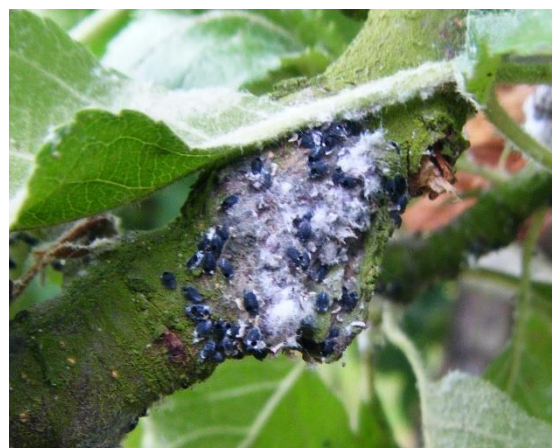
Pucerons parasités par Aphelinus mali

L'activité de parasitisme d' Aphelinus mali s'intensifie et s'installe. Il faut le préserver et lui laisser le temps de faire son travail de parasitisme. Surveillez l'installation de la faune auxiliaire. Evolution à suivre.