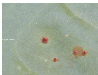
Rouille : pustules poudreuses orangées