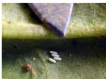
Œufs de pégomyies

La pégomyie ne présente toujours pas de risque dans la région. L'absence d'œufs de pégomyies indique qu'il n'y aura pas d'évolution de la nuisibilité dans les jours à venir.