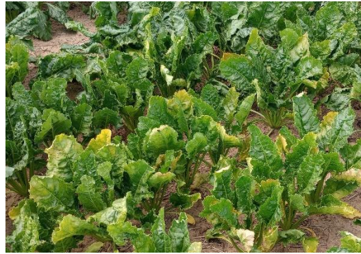
Foyers de jaunisse