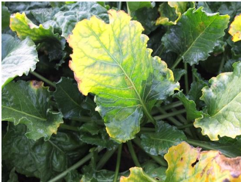
Symptômes foliaires de jaunisse

Symptômes : ils se manifestent par un éclaircissement, puis un jaunissement à partir du sommet de la feuille. Celles-ci s'épaississent et deviennent cassantes. La jaunisse se développe par foyers qui s'étendent plus ou moins dans la parcelle.