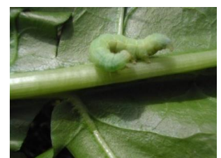
Chenille de noctuelle

Symptômes : la noctuelle défoliatrice se remarque par de nombreuses perforations sur les feuilles ainsi que par des déjections noirâtres. Les jeunes chenilles sont détectables dans le feuillage en dehors des heures chaudes de la journée.