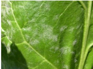
Oïdium : mycélium blanc grisâtre poudreux.