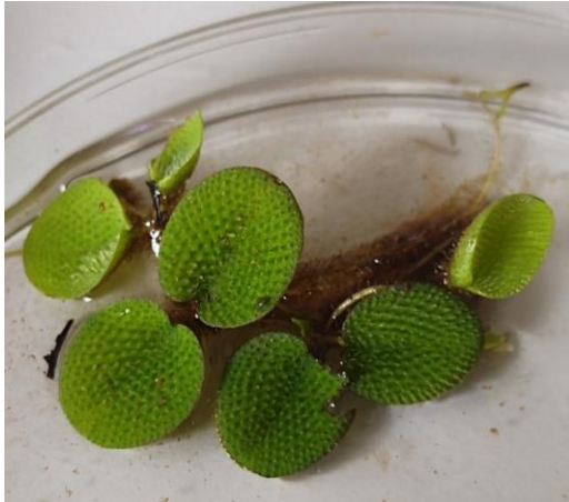
Aspect général de Salvinia minima

De la petite Salvinie a été observée dans l' Orne . Cette petite fougère aquatique est originaire d'Amérique du Sud / Amérique centrale. Il y a peu de données sur cette plante en dehors de son aire géographique originelle et elles sont récentes (entre 2019 et 2022). Elle a été observée dans l'Orne en 2023, c'est la seule localité où elle est présente en France.