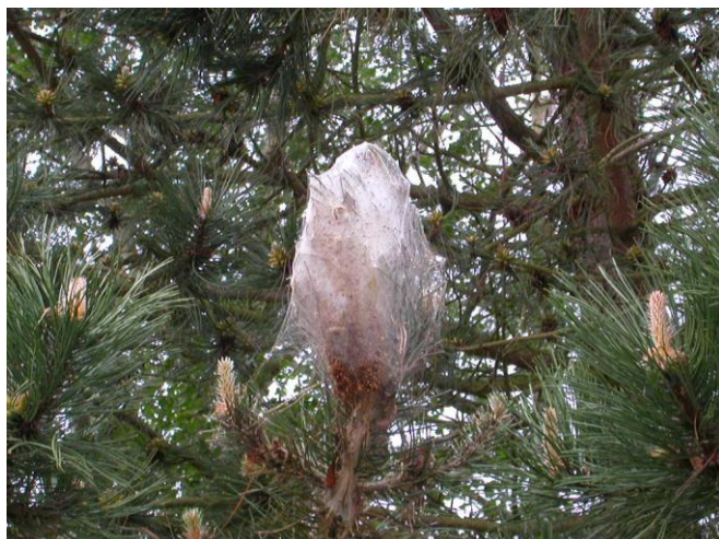
Chenille processionnaire du pin.

Les chenilles processionnaires du pin poursuivent leur cycle et une nouvelle génération est en train d'émerger. De nouvelles chenilles se développent en consommant les aiguilles et tissent de nouveaux cocons à l'extrémité des rameaux pour se protéger du froid. Des processions pourront avoir lieu dès le mois de décembre.