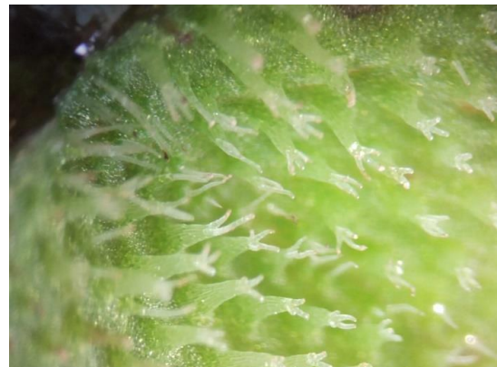
Aspect caractéristique des poils de Salvinia minima (face supérieure de la fronde)

La petite salvinie est capable de recouvrir complètement les cours d'eau et mares et provoque des dérèglements importants du milieu aquatique. Nos hivers plus doux ne permettent pas sa régulation par le froid.