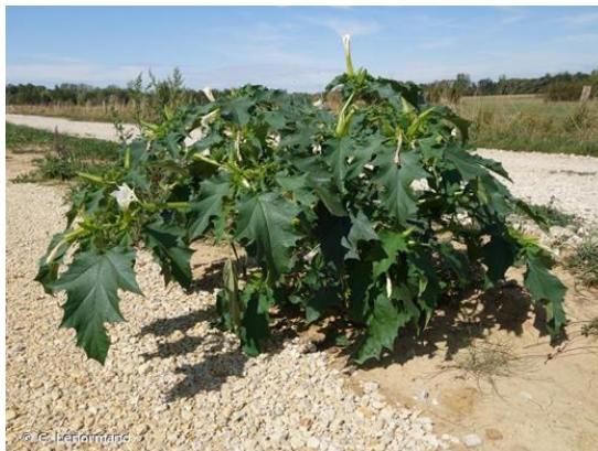
Datura en fleurs

Enfin, si vous avez repéré cette plante en Normandie, merci de nous la signaler afin de recenser les foyers et d'en surveiller la propagation.