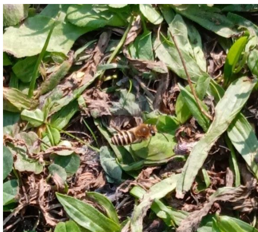
Collète du lierre posée au sol.

Pas d'inquiétude, cette abeille est aussi inoffensive qu'un bourdon.