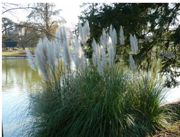
Ailante glanduleux en fleur et herbe de la pampa en fleurs (source : Centre de ressources Espèces exotiques envahissantes).

La liste complète et l'arrêté sont consultables ici :