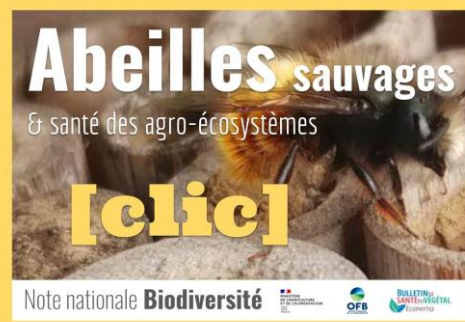
Abeilles sauvages et santé des agro-écosystèmes - Mars 2023

Si vous souhaitez devenir observateur pour le BSV Lin fibre, n'hésitez pas à prendre contact auprès des personnes suivantes :