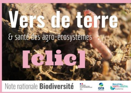
Vers de terre et santé des agro-écosystèmes - Août 2022