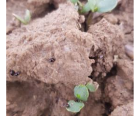
Parcelle semée le 09/04

Concernant la présence de ce ravageur dans les linières, entre 1 et 3 altises ont été dénombrées sur la feuille A4 dans 13 des 21 parcelles suivies. Elles sont comprises entre 4 et 5 dans 5 parcelles et sont plus de 6 dans 2 parcelles du réseau.