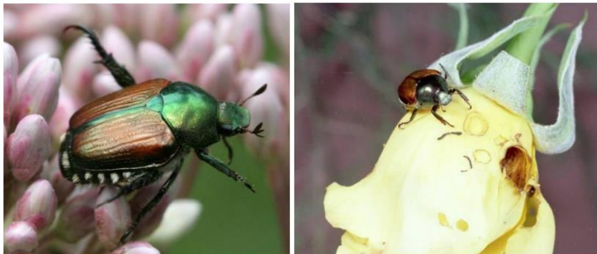
Spécimen adulte de Popillia japonica / Morsure des pétales d'une rose

Il est déjà présent en Italie et en Suisse depuis quelques années, la probabilité qu'il entre en France est haute . Cet insecte ravageur représente une menace pour des centaines d'espèces de végétaux. Pour avoir une chance de l'éradiquer du territoire, il sera nécessaire d'intervenir dès la première détection de l'insecte.