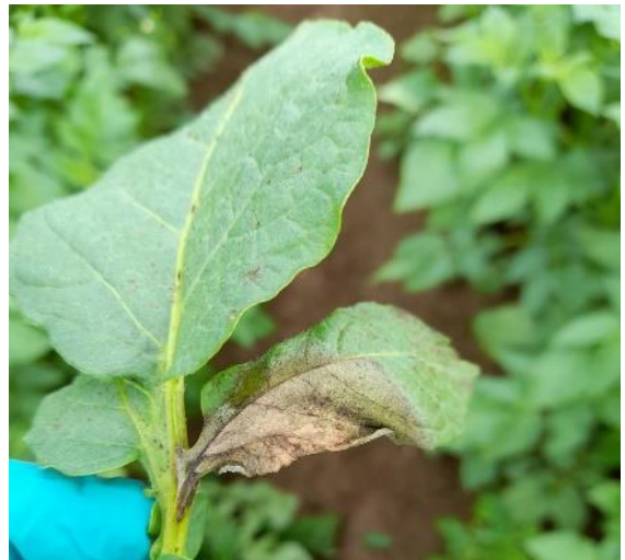
Tache de mildiou