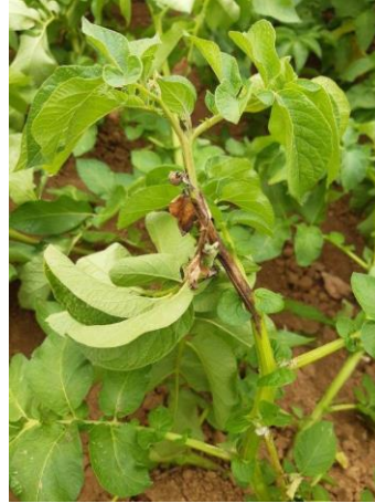
Foyer de mildiou et symptôme sur tige (Chambre d'Agriculture de Normandie)