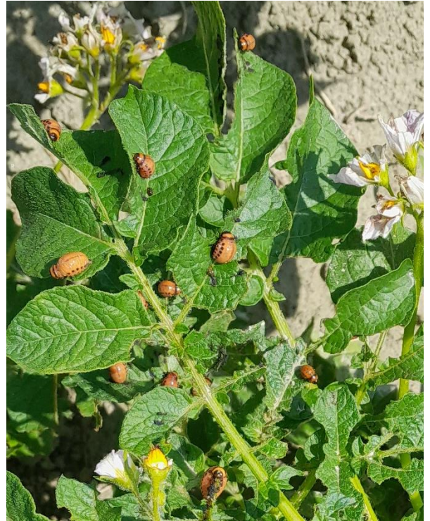
Larves de doryphore