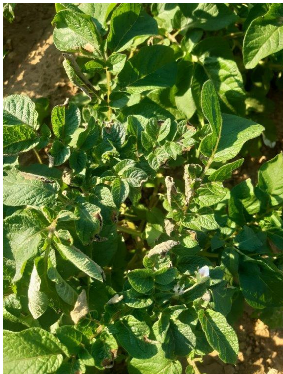
Brûlures du feuillage causées par fortes températures

Le faible nombre de parcelles observées en Haute-Normandie ne permet pas de réaliser une analyse exhaustive du risque en Normandie.