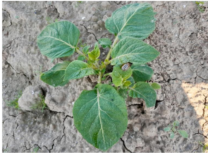
Doryphore sur pomme de terre levée, secteur Calvados

La présence de doryphore adulte a été signalée sur des pommes de terre du Calvados ainsi que sur un tas de déchets dans le secteur d'Yvetot.