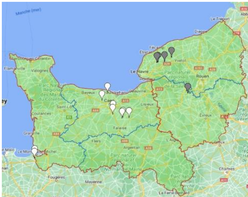
Carte des parcelles du réseau BSV Pomme de terre sur Vigicultures

Doryphores : Présence de doryphores sur repousses et en parcelles levées.