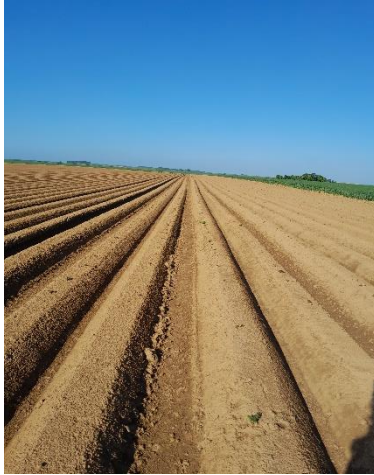
Parcelle en cours de levée, secteur Calvados

Pour certaines parcelles, les buttages définitifs n'ont pas encore été effectués.