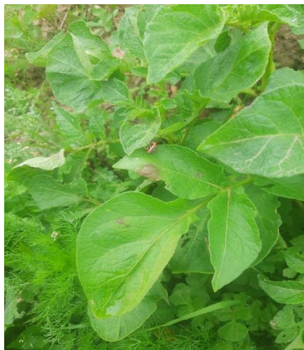
Taches de mildiou sur tas de déchets, secteur Yvetot (COMITE NORD)

Il est important de gérer les tas de déchets et les repousses pour limiter les risques d'inoculum primaire.