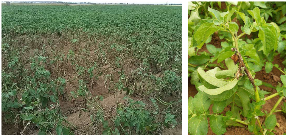
Foyer de mildiou et symptôme sur tige (Chambre d'Agriculture de Normandie)

Cette maladie est présente en parcelles de production et en jardins de particuliers.