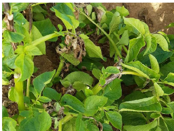
Tache de mildiou (Chambre d'Agriculture de Normandie)