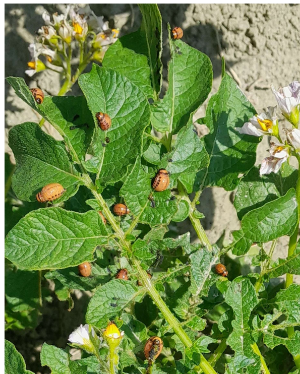
Larves de doryphore